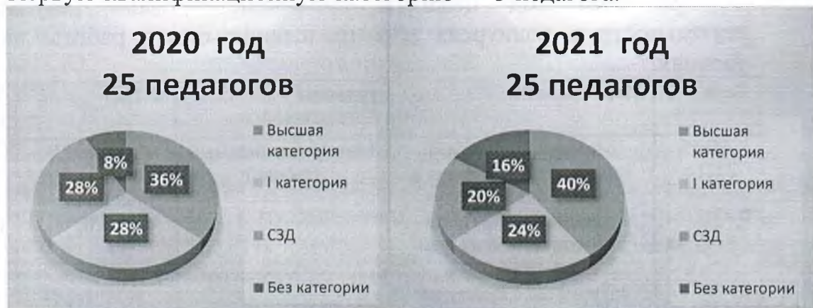
Диаграмма с характеристиками кадрового состава МАДОУ «Чердынский детский сад»